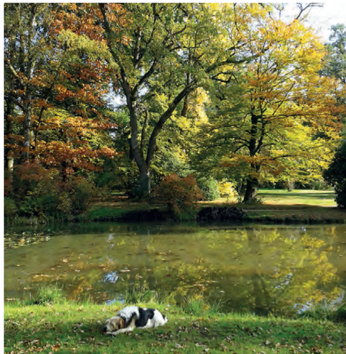
Malerisch: Breidings Garten in Soltau.