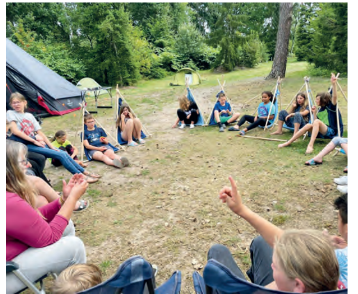
Ein Zeltlager gehört zu den Angeboten, die die Kunstschule Pinx für Kinder im Heidekreis zusammengestellt hat.

Jedes Kind zwischen zehn und 14 Jahren ist eingeladen. Auch hier wird es viel Spaß, Spiel und Kreativität geben, aber auch Aktivitäten zu Wasser, zu Land und am Feuer. Alle Ferienangebote sind kostenlos. Bei Fragen zu den Angeboten, für weitere Informationen und auch zur Anmeldung wenden sich Interessierte an das Büro der Kunstschule Pinx unter ☎ (05071) 4026 oder per E-Mail an info@kunstschule-pinx.de .