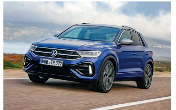
Ab sofort kann der neue VW T-Roc R bestellt werden.