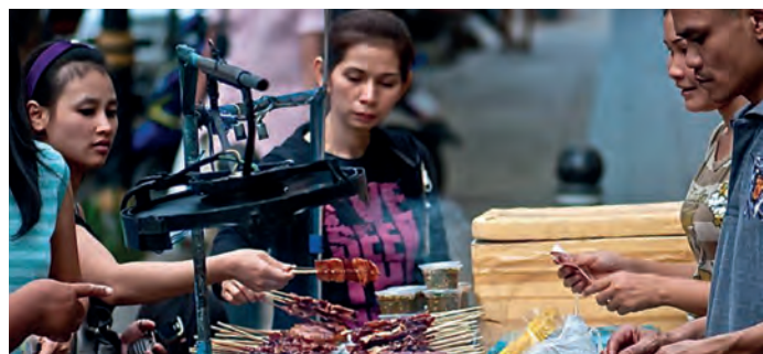
Traditionelle thailändische Speisen werden beim ersten Thai-Food-Gartenfestival vom Team der Pannee Thaimassage frisch zubereitet.

Abgerundet wird das Programm des Thai-Food-Gartenfestes durch thailändische Tanzdarbietungen und einigen Verkaufsständen. Beginn ist um 14.30 Uhr in Bad Fallingbostel, Kiefernweg 4.