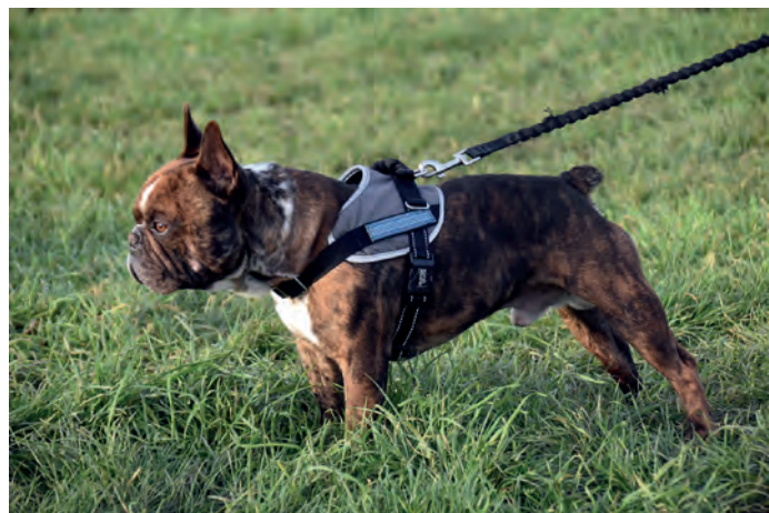
ips/OPM. Ist der Hund noch nicht leinenfähig, sollte ein Brustgeschirr verwendet werden.

der Mensch muss sich nicht auf die Leinenfähigkeit konzentrieren. Im Leinenfähigkeitstraining wird die Leine am Halsband befestigt und der Hund muss lernen, dass er dann nicht ziehen darf. Es sollte beim Kauf eines Halsbandes besonders auf starke Nähte und sichere Verschlüsse geachtet werden. Klickverschlüsse aus Metall sind solchen aus Plastik vorzuziehen, da sie bei schlechter Qualität schnell brechen. Ein breites Halsband ist angenehmer für den Hund. Beim Kauf eines Geschirres sollte besonders auf starke Nähte und sichere Verschlüsse wie Klickverschlüsse aus Metall geachtet werden. Auch macht es Sinn, ein auf den Hund individuell angepasstes Geschirr fertigen zu lassen.