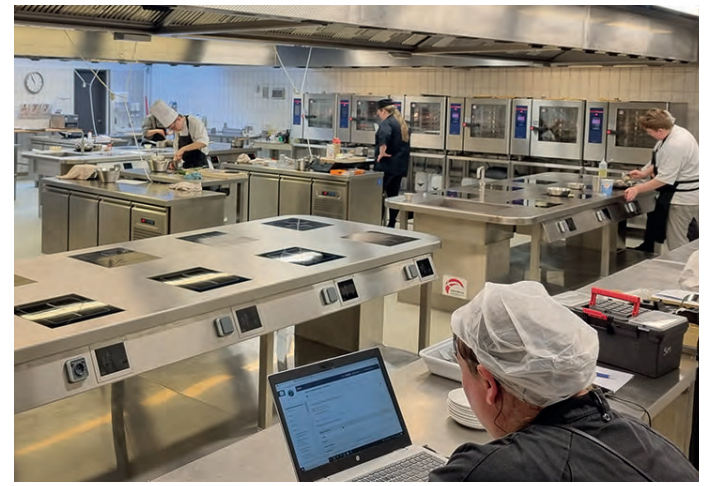
Die Schulen in Aapenraa, Tønder und Sønderborg bieten mehrere großzügige Küchen und Bäckereien für die Ausbildung von Fachkräften im Lebensmittelbereich.