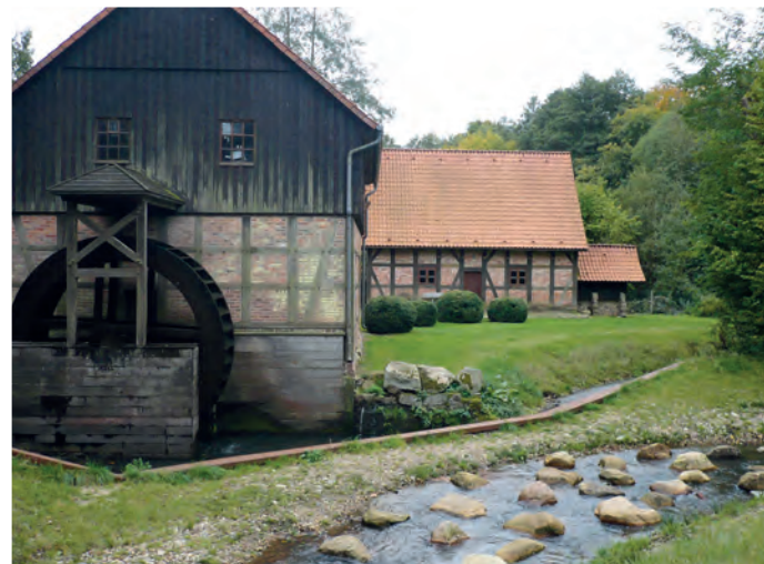
An der Cordinger Mühle findet am Pfingstmontag wieder ein buntes Programm mit Musik und Führungen anlässlich des Deutschen Mühlentages statt.

BENEFELD. Zweimal musste er coronabedingt ausfallen, am morgigen Pfingstmontag, 6. Juni, kann aber endlich der bundesweite Deutsche Mühlentag wieder stattfinden. Überall in Deutschland werden Wasser- und Windmühlen für Interessierte geöffnet sein und ihre Technik und Geschichte vorgestellt. Der Kulturverein Forum Bomlitz wird sich gemeinsam mit Partnernvereinen im besonderen Ambiente an der Cordinger Mühle in Benefeld mit einem kleinen Volksfest von 12 bis 18 Uhr beteiligen. Den Auftakt macht der Historiker Thorsten Neubert-Preine bereits um 10.30 Uhr mit einer Eibia-Kurzführung, die an der Mühle startet. Die Gruppe wird rechtzeitig zurück auf dem Mühlentag sein, wenn die Benefelder Kleingärtner ab 12 Uhr den Grill anheizen und der Elternverein der Bomlitzer Grundschule Kaffee und Kuchen anbietet.