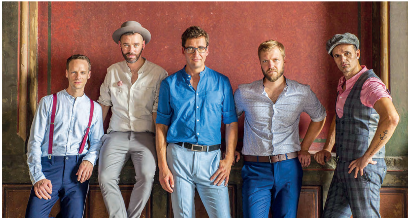
Die Musiker von „vocaldente“ formen ihre Klänge rein akustisch und mit klassischen Mitteln. Am kommenden Sonnabend treten sie im Visselhöveder Heimathaus auf.