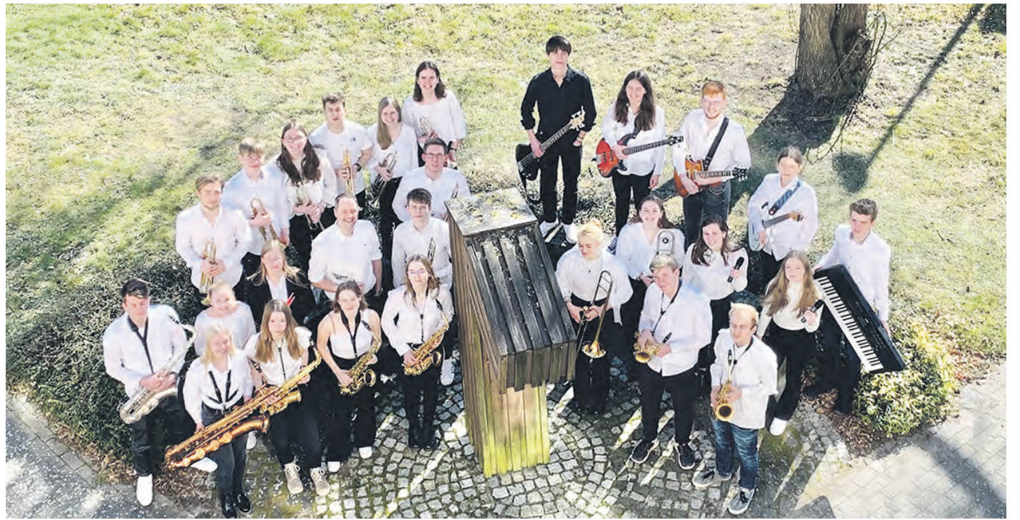
Die Soundtwisters aus Walsrode eröffnen am kommenden Freitag das „Kleine Fest im Klostergarten“.