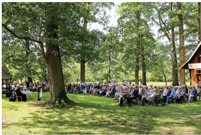
Unter grünem Blätterdach: Der Dorfmarker Gottesdienst im Freien erfreut sich stets großer Beliebtheit.

DORFMARK. Alljährlich im Juni erfreut sich der Open-Air-Gottesdienst unter den mächtigen Eichen des mitten im Ort gelegenen Dorfmarker Pfarreichhofs großer Beliebtheit. Große und kleine Gottesdienstbesucher aus der Dorfmarker Kirchengemeinde und auch Gäste schätzen die stimmungsvolle Atmosphäre unter einem grünen Blätterdach und rund um den historischen Treppenspeicher mit Blick auf das ehrwürdige Pfarrhaus, dessen neues Reetdach schon die Freude auf die vollständige Renovierung erahnen lässt.