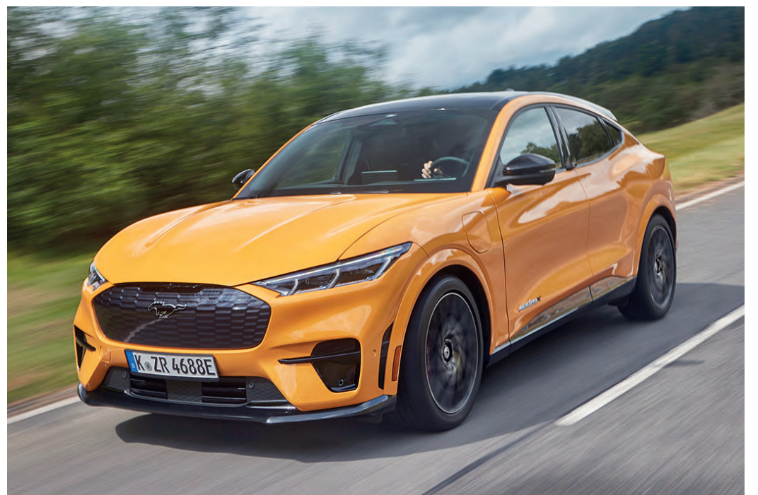
Der Ford Mustang Mach E GT ist ein urgewaltiger Vorbote der umfangreichen Elektrifizierung der gesamten Fahrzeugflotte.

tizität sollte es nie wieder Probleme beim Überholen von Lastkraftwagen auf Landstraßen geben. Dass erst bei 200 km/h Schluss mit der Freude nach vorn ist, liegt an der Abriegelung des bärenstarken Vortriebs. Beeindruckend ist das optisch beherrschende 15,5 Zoll-Display. Der Monitor erinnert stark an die Ausstattung des amerikanischen Mitbewerbers Tesla. Hier werden die gesammelten Daten übersichtlich angezeigt. Alle Einheiten sind zudem recht einfach zu bedienen. Wenngleich Ford eine Reichweite von 500 Kilometern avisiert, kann es nicht