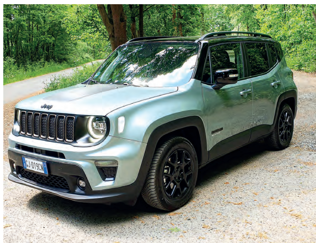
Nach den beiden Plug-In-Hybrid-Modellen ist der Jeep Renegade jetzt auch mit Mild-Hybrid-Motor zu haben. Als e-Hybrid kostet er ab 31.700 Euro.

Neuaufgabe des extrem sportlichen Kompakt-SUV für R-typische Dynamik. 4,9 Sekunden genügen für den Spurt aus dem Stand auf 100 km/h. Kombiniert wird das mitreißende Performance-Erlebnis jetzt mit einem umfangreichen Technologie-Update. Der neue T-Roc R verfügt mit Front Assist und Lane Assist bereits serienmäßig über fortschrittliche Assistenzsysteme. Der neue „IQ.DRIVE Travel Assist“ und die vorausschauende Geschwindigkeitsregelung „Prädiktives ACC“ ermöglichen assistiertes Lenken, Bremsen und Beschleunigen bis Tempo 210. Ein neues Niveau erreicht auch die Auswahl der digitalen Funktionen, darunter die natürliche Online-Sprachbedienung und der Zugriff auf Streaming-Dienste. Serienmäßig stehen die Services von „We Connect Plus“ in Europa für ein Jahr kostenfrei zur Verfügung.