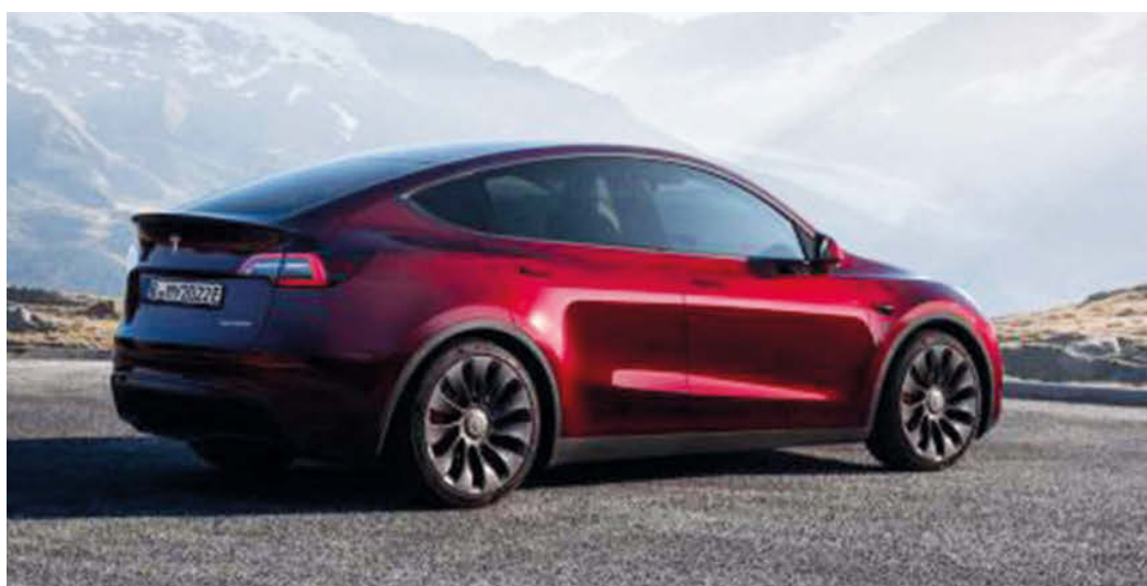
Der Tesla Model Y ist das weltweit am meisten verkaufte Elektromodell und konnte sich auch in Deutschland im Spitzenfeld platzieren.

Zu den frischen Features gehören das „Digital Cockpit“, ein Multifunktionslenkrad, eine elektronische Parkbremse und diverse Assistenzsysteme. Wesentliche Option ist dabei der digitale Sprachassistent mit ChatGPT-Integration. Der Vorverkauf des neuen Crafter beginnt Mitte April.