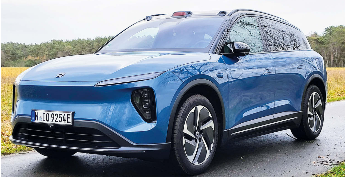
In der SUV-Klasse ein Modell, das die Autofahrgemeinde in Erstaunen versetzt – der Nio EL6 begeistert mit Technik und Komfort.

Da die Karosserie gegen unangenehme Wind- und Abrollgeräusche optimiert wurde, die Elektromotoren unhörbar ihren Dienst versehen, bleibt die Geräuschkulisse der 1000-Watt-Anlage mit den 23 Lautsprechern vorbehalten. Wie in einem Konzertsaal gleiten die bis zu fünf Passagiere mit achtbaren 597 Litern Ballast im Gepäckraum durch die Lande. Wenn es nötig ist, werden auch bis zu 1200 Kilogramm in gebremstem Zustand an die Anhängerkupplung genommen. Ein Dienst, der von dem Nio EL6 kaum wahrgenommen wird. Er schwebt über den Dingen und kann sich auf die Kraft seiner 100 Kilowattstunden-Batterie verlassen.