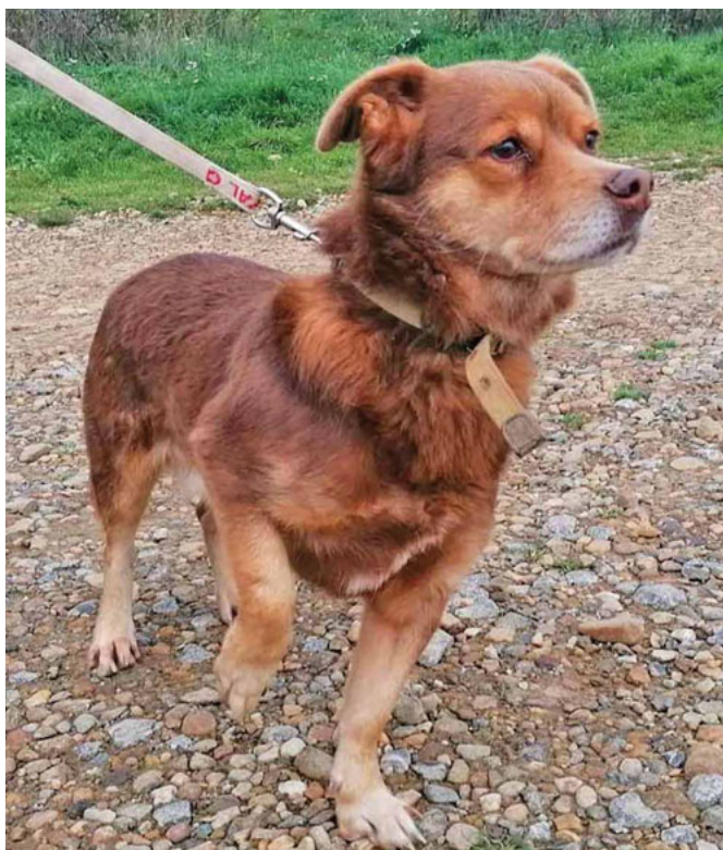
Misha braucht ein Zuhause bei hundeerfahrenen, auch gerne älteren Leuten.

Misha braucht ein Zuhause bei hundeerfahrenen, auch gerne älteren Leuten, die sich einen lebenserfah-