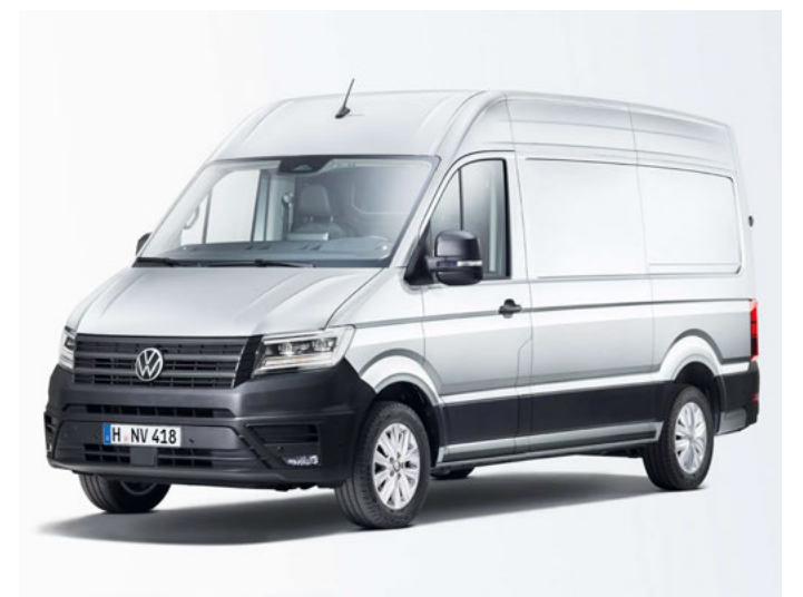
Volkswagen Nutzfahrzeuge hat den Crafter insbesondere elektronisch aufgewertet.

Auf den ersten Plätzen der Zulassungsstatistik der Elektroautos landeten folgende Modelle: 1. Tesla Y (251.617 Stück), 2. Tesla 3 (100.888) 3. VW ID.4 (85.088) 4. MG 4 (72.212) 5. Skoda Enyaq (66.247) 6. Fiat 500 (64.244) 7. VW ID.3 (63.460) 8. Dacia Spring (59.186) 9. Volvo XC40 (50.976) 10. BMW i4 (48.958).