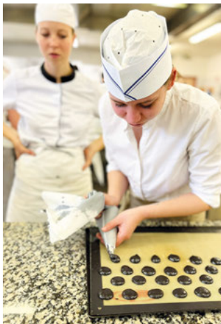
Dabei ist Fingerspitzengefühl gefragt: Volle Konzentration bei der Macaronherstellung.

Am Lyceé de Robert Buron in Laval, rund 150 Kilometer südlich von Paris, erhielten die Nachwuchskräfte von 13 französischen Auszubildenden sprachliche und fachliche Einblicke