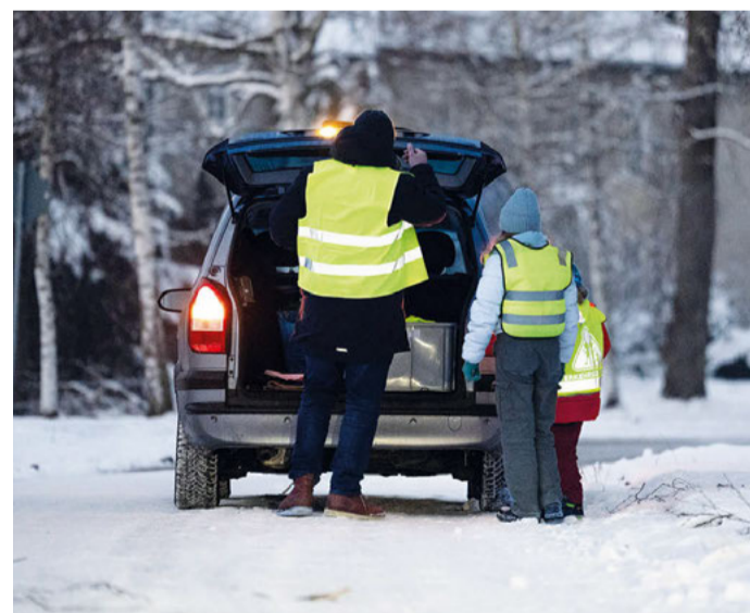
Mehr als 30 Prozent der vom ADAC getesteten Warnwesten sind mangelhaft und reflektieren fast gar nicht.

Der ADAC hat online 14 Westen, darunter Kinder- und Erwachsenenmodelle, beschafft und diese mit einem Prüfset einem ersten