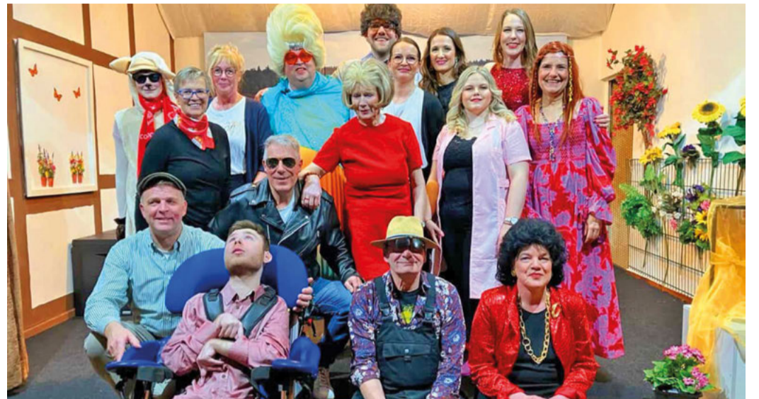
Buntes Ensemble: Die Darsteller bekamen viel Applaus für ihre Darbietung.

Die Spenden kommen dem Verein NCL Deutschland zugute, da die Protagonisten mit einer Familie aus Sieverdingen befreundet sind, deren Kind von diesem NCL-Gendefekt (besser bekannt unter Kinder-Demenz) betroffen ist. NCL ist unheilbar und lebenslimitierend, weitere Informationen unter www.ncl-deutschland.de .