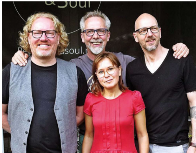
„Pepper & Soul“: Die Band hat Geschichte und ist schon mehr als zehn Jahre in verschiedenen Besetzungen unterwegs.

Am Sonnabend, 9 März, spielt „Pepper & Soul“ ein Konzert. Die Band hat Geschichte und ist schon mehr als zehn Jahre in verschiedenen Besetzungen unterwegs. Als klassische Soulband kann man sie heute nicht mehr bezeichnen. Die Band ist moderner geworden. Viel Gesang und prägender Groove sind geblieben und werden mit moderneren Songs auf eine neue Dekade geschwungen. Spaß und Zusammenhalt hat diese Band in der neuen Besetzung geprägt und will dieses übertragen. Harmonisches Miteinander, mit Lust und großer Spielfreude am Experimentieren wollen wir unser Publikum begeistern und mitreißen zum stillen Genießen, zum Mitsingen und -tanzen. Beginn ist um 20 Uhr, Einlass um 19.30 Uhr. Der Eintritt beträgt 15 Euro im Vorverkauf, an der Abendkasse 18 Euro.