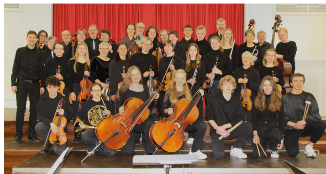
Das Ensemble des Gymnasiums.

Fortgesetzt wird das Konzert mit dem Werk „Die Lerche steigt auf“ des britischen Komponisten Ralph Vaughan-Williams. In zunächst leisen, sphärischen