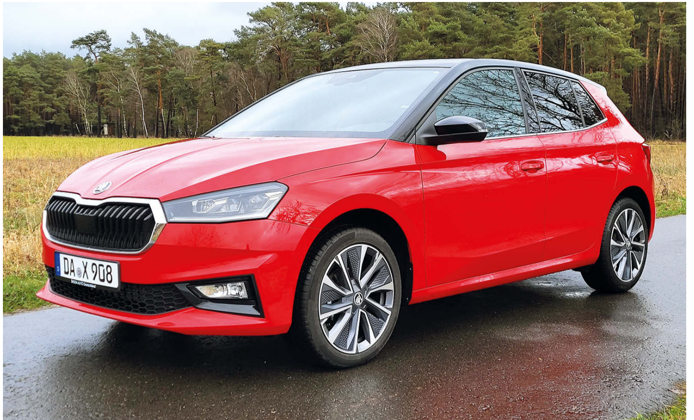
Hat sich zu einem ansehnlichen Fahrzeug mit achtbarem Platzangebot gemauert – der Skoda Fabia Style 1.0 TSI.

Für diese Bewegung hat Skoda dem Modell Fabia Style einen Dreizylindermotor spendiert, der relativ laut agiert, wenn ein Vierzylinder zum gewohnten Akustikbild gehört. Erst nach Erwärmung des Aggregats pendelt sich die Geräuschkulisse ins Normalmaß ein. Sollte allerdings eine spontane Leistungsexplosion erfolgen, beschwert sich der Motor lautstark aus dem Frontbereich. Immerhin lassen die 95 Pferdestär-