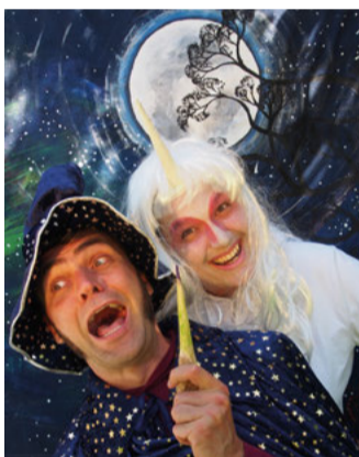
Eine magische Geschichte über die Schönheit von Diversität und dem Zauber der Natur.

Aufgrund der Baustelle auf der Hauptstraße wird vom Veranstalter empfohlen, am Marktplatz zu parken und den kurzen Weg zum Heimathaus zu Fuß zu gehen.