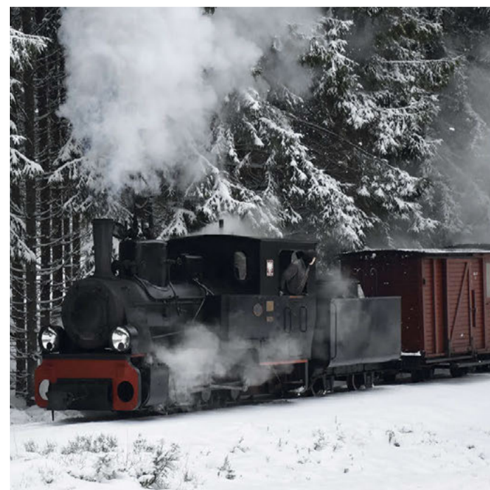
Eine historische Fahrt mit Dampflokotiven aus dem 20. Jahrhundert.

Weitere Informationen zum Weihnachtsmannzug: www.ohsaban.se/?lang=de .