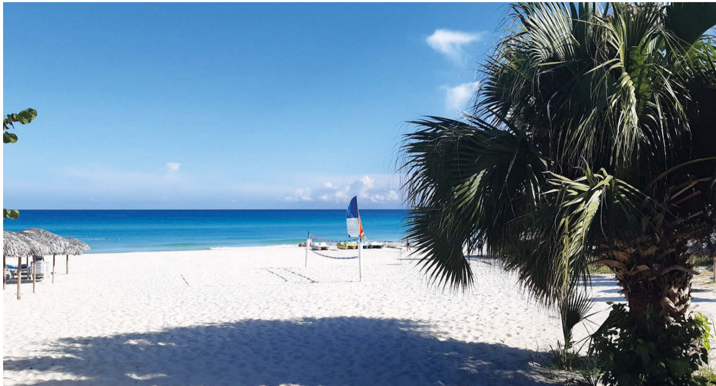
Traumhafte Strände aus feinstem Sand vor blauem, glasklarem Meer erwarten die Urlauber auf Kuba.