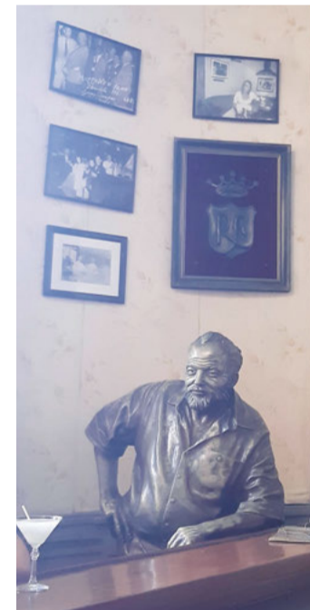
Erinnerung an einen berühmten Gast: Ernest Hemingway in der Bar „La Floridita“ in Havanna..