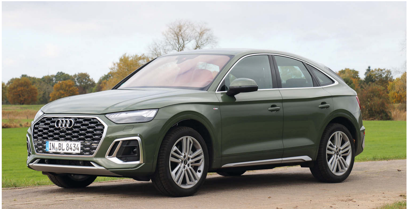
Komfortabel und bequem – Audi hat mit dem Q5 Sportback 50 TDI quattro ein praktisch orientiertes Modell gebaut.

Dass der Audi Q5 Sportback mit in der S-line-Ausführung und mit dem Allradantrieb ein Meister der Hilfsbereitschaft für Menschen ist, die hin und wieder etwas an die Anhängerkupplung nehmen müssen, versteht sich von selbst. Das kraftvolle Drehmoment von 620 Newtonmeter werden aus dem 6-Zylinder-Motor bezogen, der von einem Turbolader mit 2,3 bar be-