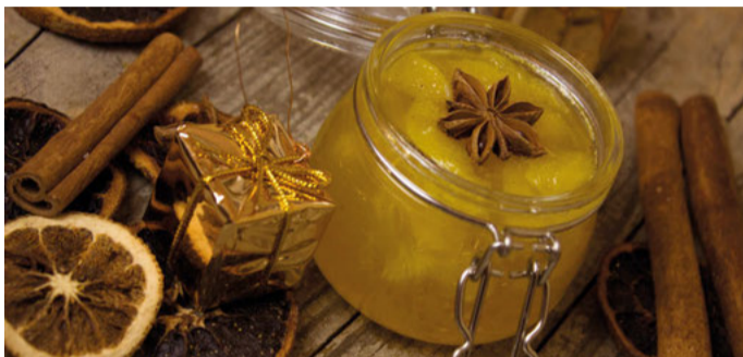
Wintermarmeladen schmecken weihnachtlich und lassen sich gut verschenken.

Ips/Jv. Die fruchtige Süße von Orangen und Mandarinen bei einer selbstgemachten Weihnachtsmarmelade passt hervorragend zu den weihnachtlichen Gewürzen wie Zimt und Sternanis. Auch Birnen, Beeren und Äpfel eignen sich für einen selbstgemachten Brotaufstrich zur Weihnachtszeit. Eine Bratapfelkonfitüre oder ein Glühweingelee schmecken hervorragend auf Toastbrot zum Sonntagsfrühstück oder auf kleinen Küchlein am Nachmittag. Experimentierfreudige Hobbyköche nutzen einen Hauch von Ingwer, um manchen Kombinationen eine leichte Schärfe zu verleihen. Häufig werden die Begriffe Marmelade, Konfitüre und Gelee synonym gebraucht. Die Unterschiede liegen jedoch in der Fruchtart, dem Zuckergehalt und der Zubereitung.