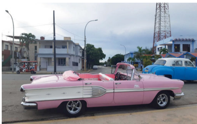
Autos und Häuser erwecken den Eindruck, man sei in die 50er-Jahre zurückgereist.

Museum und unbedingt einen Besuch wert. Die größte Attraktion liegt im Untergrund – die Cuevas de Bal-lamar. Mit Kopfleuchte und in Begleitung gilt es dunkle Höhlenteile zu erkunden.