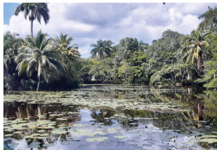
Eintauchen in den Dschungel: Kuba bietet faszinierende Naturerlebnisse.

„Das Athen Kubas“ wird die Stadt Matanzas genannt, die 32 Kilometer von Varadero liegt. Dort spiegeln sich die Glanzzeiten des Zuckerrohrhafens wider. Die gut erhaltene alte Apotheke Triolet ist heute