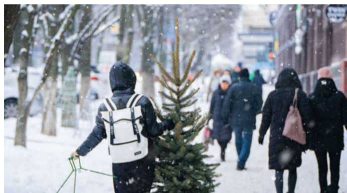
Die meisten Menschen lieben das Weihnachtsfest und beginnen schon viele Tage zuvor mit der Vorbereitung.

Laut einer EU-Verordnung ist der Begriff Marmelade den Zitrusfrüchten vorbehalten. Bei der Verwendung anderer Fruchtarten wird es Konfitüre genannt. Das Gelee hingegen besteht nicht aus eingekochten Früchten wie die Marmelade oder Konfitüre, sondern es wird aus Fruchtsaft, Zucker oder Fruchtsaftkonzentrat gefertigt. Die Herstellung der fruchtig-süßen Brotaufstriche benötigt Zeit. Es empfiehlt sich, gleich mehrere Gläser mit den weihnachtlichen Kreationen zu füllen und die Dekoration aus dem Schreibwarengeschäft oder Kaufhaus für die Verzierung der Gläser bereitzuhaben. Wird man in der Adventszeit bei Verwandten oder Freunden eingeladen, kann die selbstgemachte Weihnachtsmarmelade ein passendes Mitbringsel sein.