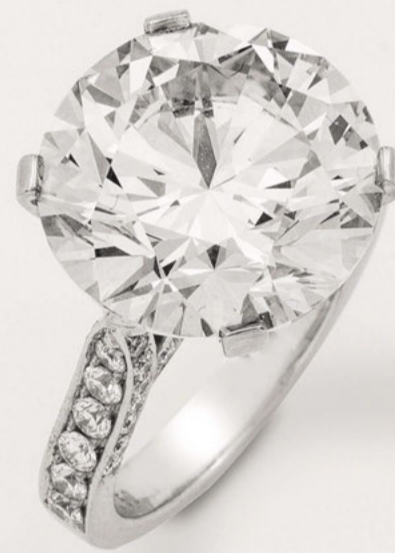
• Mehr als eine Million Euro war dieser Ring einem Käufer wert.

Mehr als 3000 größere und kleinere Kunstschätze kamen so im Zuge der Dezemberauktion über drei Tage hinweg auf Schloss Ahlden zum Aufruf. Nicht versteigerte Objekte können noch bis Ende Januar im Nachverkauf erworben werden.