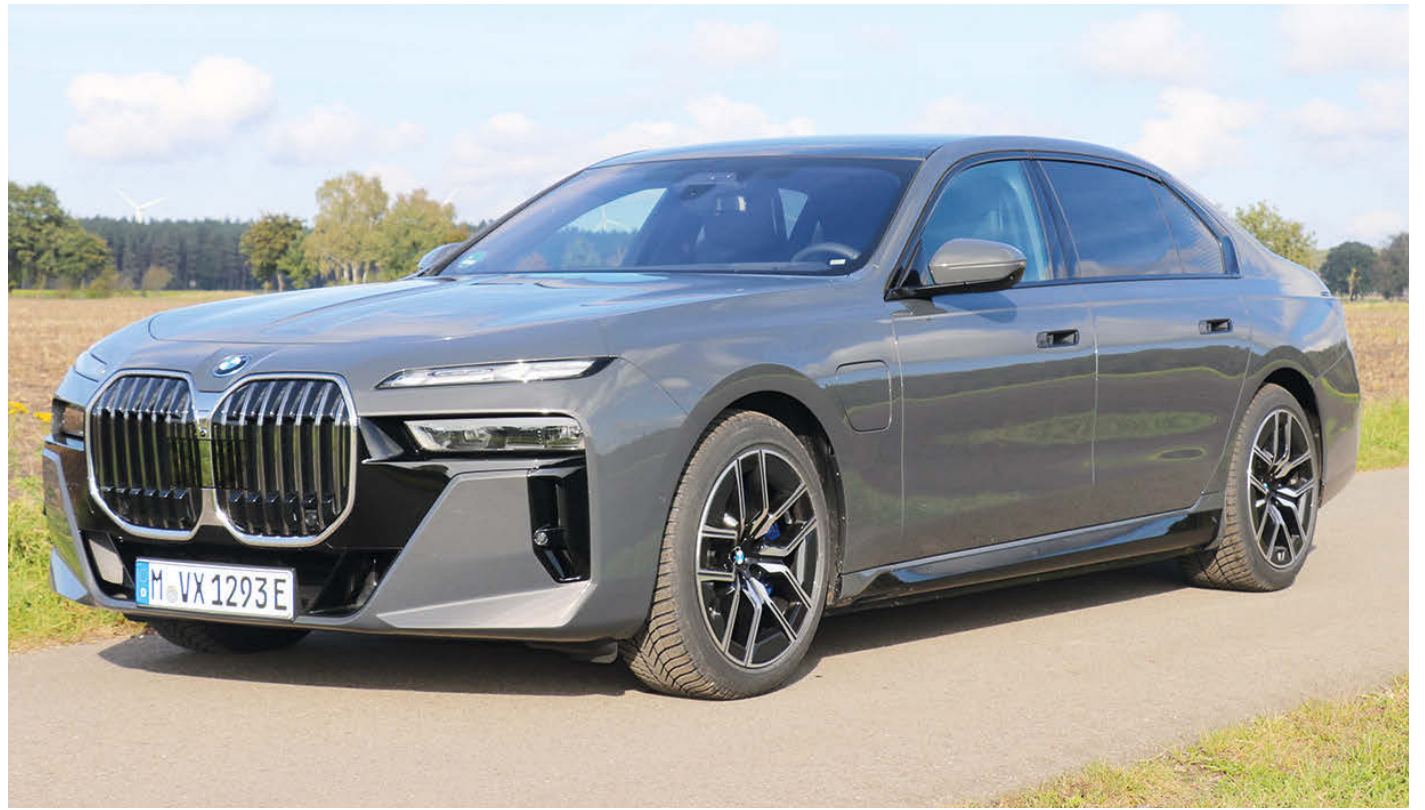
Fahren in der technisch höchsten Liga – mit dem BMW 750e xDrive ist das möglich.

Durch das über zwei Kammern luftgefederte System der Edelkarosserie ist der uneingeschränkten Nutzung von elektronischem Gerät im Fahrzeug keine Grenze gesetzt. Eine Wanksteuerung ergänzt den Genuss für die Insassen überdies. Die Ruhe beschränkt sich dabei nicht nur auf den Fahrkomfort. Auch das Zusammenspiel zwischen Elektro- und Benzinmotor gelingt harmonisch und ruckfrei. Die Leistung von maximal 700 Newtonmeter wird übrigens gemeinsam von einem lauffähigen Reihen-Sechszylinder und dem Elektroaggregat erarbeitet.