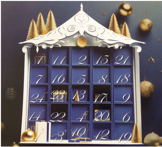
24 lokale Geschäfte machen mit: Die Aktion findet zum ersten Mal in Walsrode statt.

Der Zauber des ersten Türchens hat sich so zum Beispiel in „Stadtländers Esszimmer“ im Großen Graben entfaltet. Die Besucherinnen und Besucher konnten den festlichen Meinerdinger Kirchstollen entdecken, der extra in der Kir-