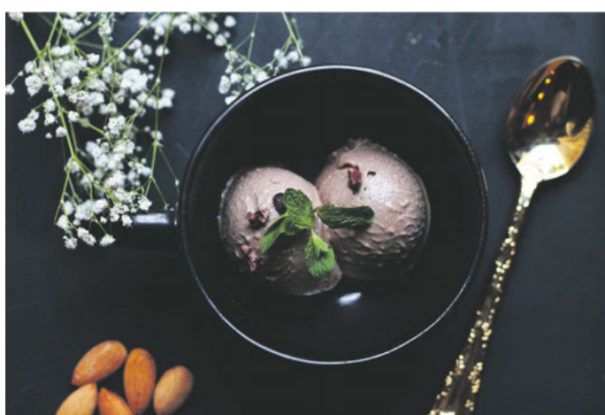
Eis bildet dank seiner cremigen Süße den perfekten Abschluss des Weihnachtsmenüs.