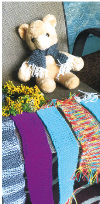
Die Göttinger Uni-Kinderklinik braucht wärmende Teddy-Schals für ihr Projekt Teddybärkrankenhaus.

Sie hofft nun, weitere Stricker und Häkler zu finden, die in der Winterzeit ihre Finger für einen guten Zweck bewegen wollen. Die fertigen Schals können an die Fachschaft Medizin, Projekt Teddybärenkrankenhaus, Goßlerstraße 16a, 37073 Göttingen, geschickt werden.