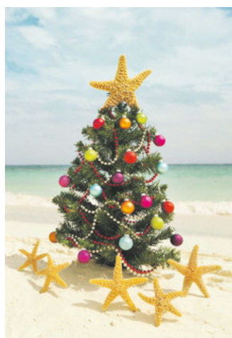
Einige entfliehen dem Winter zur Weihnachtszeit und reisen in wärmere Regionen.

ein beliebtes Reiseziel zur Weihnachtszeit. Die Flugdauer von Deutschland beträgt in vielen Fällen nicht länger als fünf Stunden. Das Wetter im Dezember ist mild bei Temperaturen um die 20 Grad Celsius. Viele Hotels offerieren Möglichkeiten zum Feiern des Weihnachtsfestes. Zu einer typischen Weihnachtstradition zählt der Besuch der imposanten Sandkrippe am Strand von Las Canteras. Die überdimensional großen weihnachtlichen Sandskulpturen sind beeindruckend und werden nicht nur von den