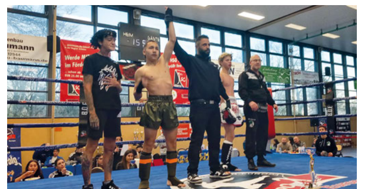
Nevado Bern feierte einen der Erfolge der Factory Fighter aus Rethem bei der Fight Night in Nienburg.

Trainerin und Großmeisterin Maren Freese, freute sich, dass sich das harte Training und der viele Schweiß für ihre Kämpfer ausgezahlt hat.