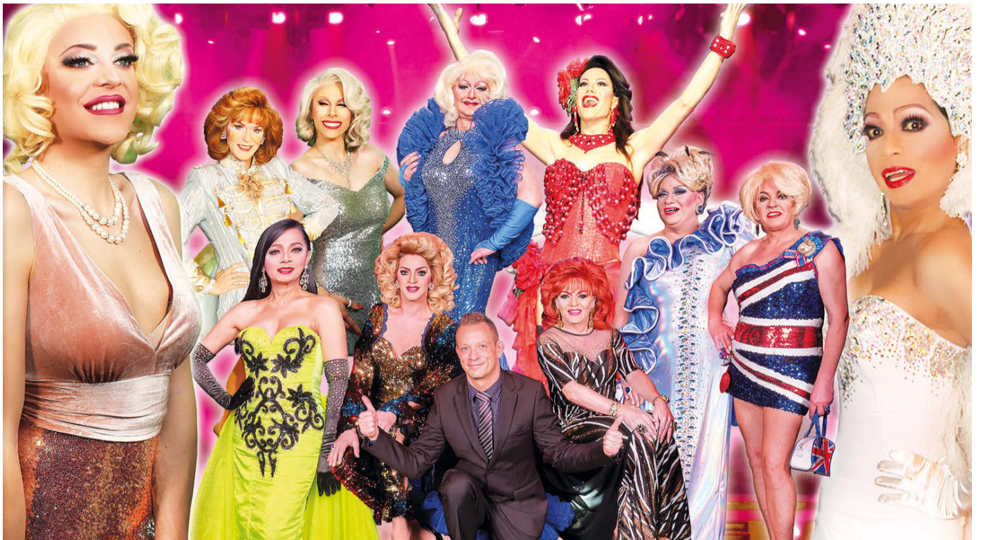
Namhafte Künstler aus den bekanntesten Kabarets Deutschlands wollen am 27. Dezember in der Walsroder Stadthalle mit ihrer schrillen Gala-Revue wieder ihr Publikum begeistern.

Viele stehen daneben. Gucken sich das Glaubensschiff an. Falls das auch für Sie gilt, möchte ich Sie herzlich und dringend bitten: Steigen Sie ein und seien Sie mit Jesus unterwegs in einem Boot. Bei gutem und schlechtem Wetter! Mit ihm haben wir ein gutes Ziel!