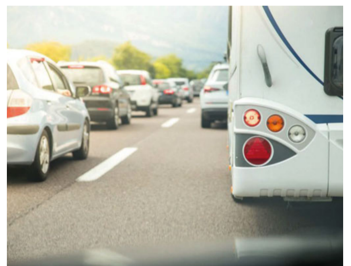
Reifen mit zu wenig Fülldruck können gerade bei Hitzewelle ausfallen.

Schon bei einer Temperatur von 30 Grad kann sich der Asphalt auf 60 Grad erwärmen. Die Hitzewelle in Europa lässt die Temperaturen mancherorts schon an die 40-Grad-Grenze steigen, für Südeuropa werden schon knapp 50 Grad vorhergesagt. Damit sind Asphalttemperaturen von über 80 Grad durchaus möglich, erläutert Schlenke. „Schon aus Selbstschutz sollte man bei solchen Temperaturen