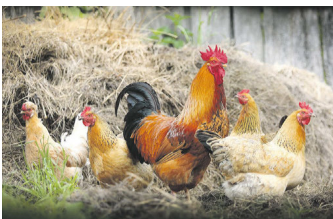
Der Code auf einem Ei gibt an, ob es sich wirklich um „Eier von glücklichen Hühnern“ handelt.

Ips/DGD. Massentierhaltung und nicht artgerechte Lebensbedingungen für Nutztiere stehen unlängst nicht nur bei bekennenden Tierschützern in der Kritik. Die Rufe nach besseren Haltungsbedingungen für Tiere in der Landwirtschaft werden immer lauter. Immer mehr Menschen greifen zu Tierprodukten, bei denen auf eine artgerechte Haltung geachtet wird. Aktuell existiert zwar noch keine einheitliche Definition zum Begriff Tierwohl. Dennoch gibt es einige Punkte, die auf bessere Haltungsbedingungen hindeuten, auf die ein Verbraucher achten kann. Beispielsweise besteht mittlerweile eine Kennzeichnungspflicht auf Eiern. Der auf den Schalen aufgedruckte Code gibt an, um welche Haltungsform