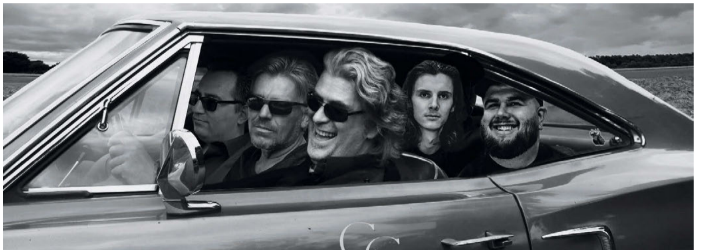
Die Musiker der Band „The Canadian Club“ treten beim fünften Walsroder Weinfest mit beliebten Rocksongs und Eigenkompositionen auf.

Forum Bomlitz lädt zum fünften Walsroder Weinfest am 2. September ein