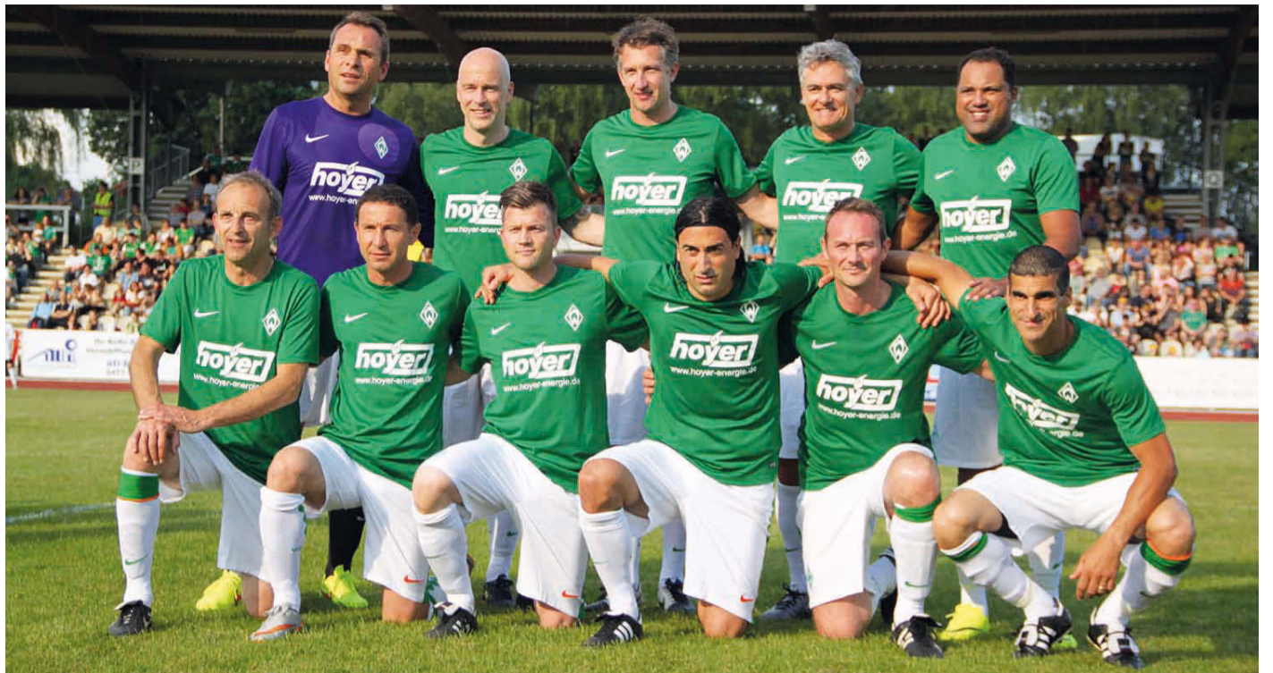
2016 holte die Wilhelm Hoyer GmbH & Co. KG die Traditionsmannschaft von Werder Bremen zuletzt in der Region. Damals spielten die Ex-Profis gegen den FC Verden 04.

Vor dem Beginn eines Trainingsprogrammes sollte immer eine Absprache mit einem Arzt oder Sportphysio stattfinden, besonders wenn Sie über 40 Jahre alt sind oder in der Vergangenheit Probleme mit Herzkrankheiten oder Blutdruck hatten. Um herauszufinden, welche Kombination von Übungen optimal für Ihre Bedürfnisse ist, wird Ihnen ein Experte in Ihrem Fitnesscenter sicher gerne weiterhelfen.