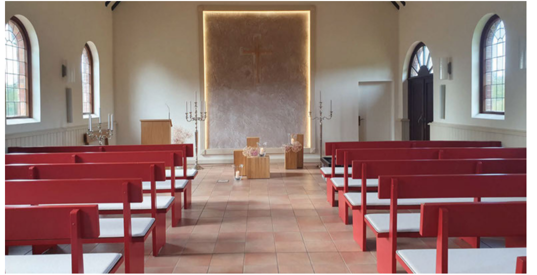
Von schlichter Schönheit: die sanierte Meinerdinger Abschiedshalle.

schließend sind alle Besucher zu einem Spaziergang über den Friedhof eingeladen, um dabei festzustellen, dass ein Friedhof nicht nur ein Ort zum Trauern ist, sondern durch seine Gestaltung zu einer besonderen, natürlichen und lebendigen Schönheit werden kann.