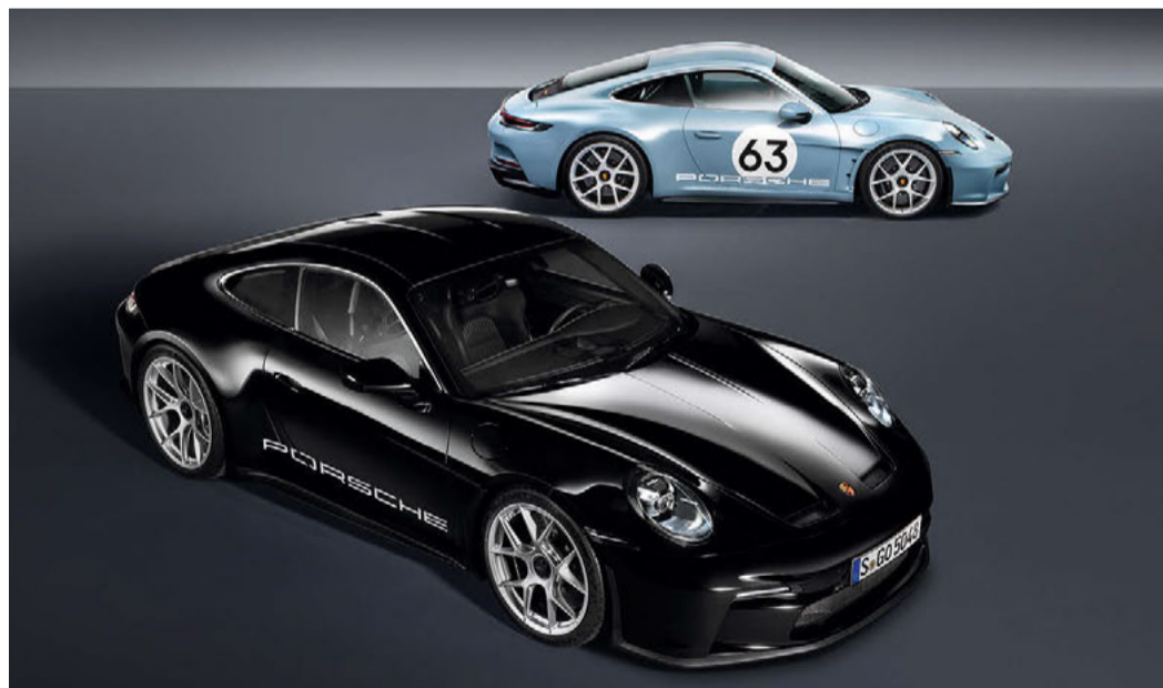
In limitierter Auflage wird der Porsche 911 S/T für 292.187 Euro angeboten.

Während sich viele chinesische Hersteller mit einem Händlernetz schwer tun und sich oft auf Online-Betreuung zurückziehen, ist Ora mit 300 deutschen Händlern, die der Frey-Gruppe angehören, gut vertreten. Kurt Sohnmann