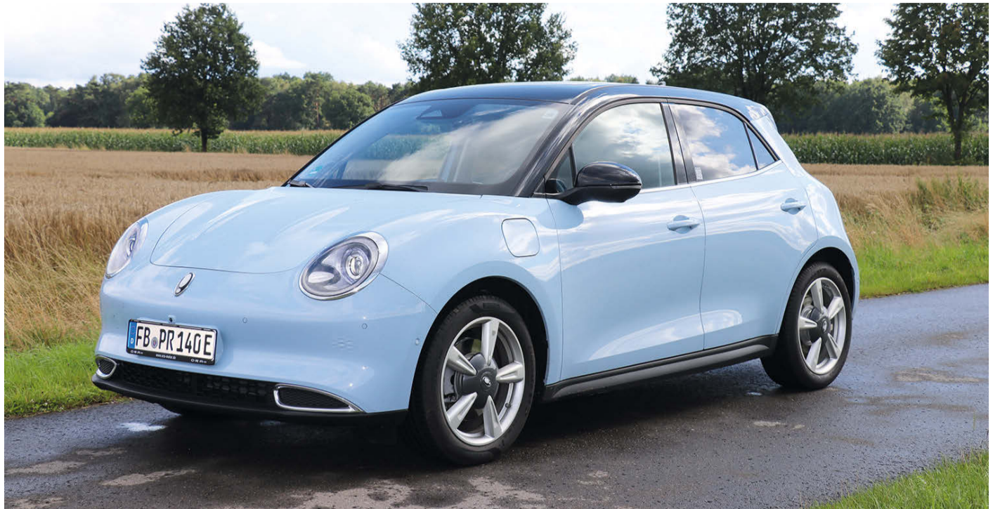
Im Retro-Style mit viel Elektro-Power und großer Reichweite: die Funky-Cat Ora 400 Pro+.

matrisch wieder aktiv ist. Aber das sind Eigenarten des Ora Pro 400+, die sich schnell in den Griff kriegen lassen, teilweise sogar amüsant sind. Unglücklicher sind hingegen die Einstellungen über ein relativ undurchsichtiges Menü des Displays. Wohl dem, der vor der Fahrt alles so geregelt hat, dass er nicht mehr eingreifen muss. Soll die Fahrt mit vier Personen stattfinden, bietet der Ora ausreichend Platz für jeden Passagier. Bei einer Mitfahrerin oder einem Mitfahrer mehr wird es schon etwas eng.