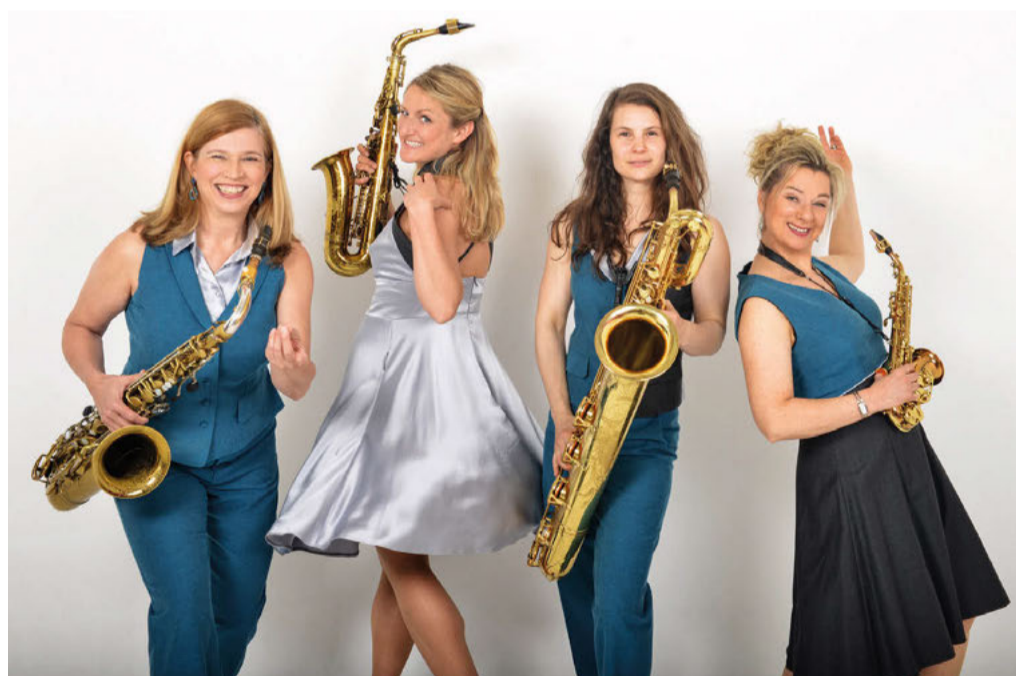
Pop, Jazz, Soul und Weltmusik: Das Quartett verspricht spannendes Musik-Entertainment.

Der Einlass zum Glissando-Konzert erfolgt ab 19.30 Uhr, es herrscht freie Platzwahl im Burghof-Gewölbe. Weitere aktuelle Informationen gibt es auch im Internet auf der Homepage unter www.burghof-rethem.de .