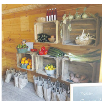
In Hofläden kann man frisches Gemüse direkt vom Erzeuger kaufen.

Ips/DGD. Klimakrise, Dürren und wachsende Bevölkerungszahlen sind Herausforderungen, denen sich die moderne Gesellschaft stellen muss. Ein wichtiger Bereich, der von diesen Entwicklungen beeinflusst wird, ist die Landwirtschaft. Daher gibt es seit einiger Zeit viele Bemühungen, die Landwirtschaft nachhaltiger zu gestalten. Das bedeutet, dass mit den vorhandenen Ressourcen schonend umgegangen wird und die vorhandenen Nutzflächen nicht übermäßig ausgebeutet werden. Die Problematik ist komplex, denn auch der Konsument ist hierbei gefragt. Steigen