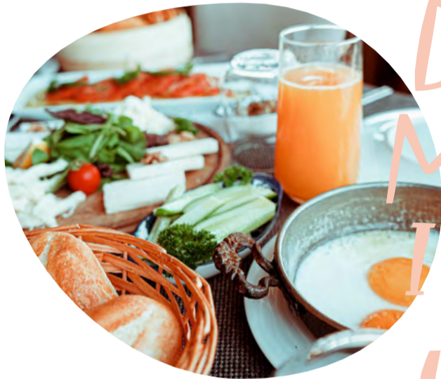
Bei einem Brunch wird nach Herzenslust geschlemmt.