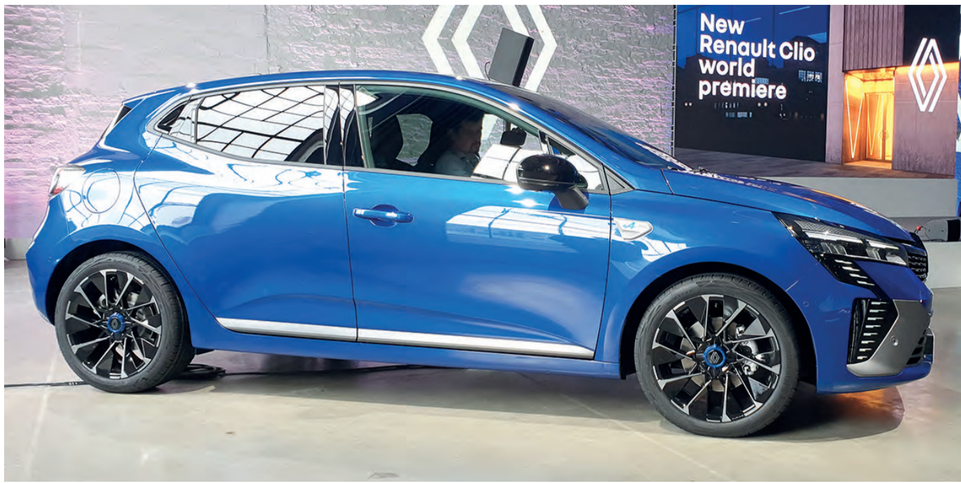
Der Renault Clio geht in seinen nächsten Jahrgang und kann ab Juni bei den Händlern in vier unterschiedlichen Motorisierungen bestellt werden.