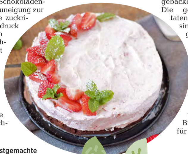
Eine selbstgemachte Erdbeertorte ist ein leckeres Geschenk zum Muttertag.

kann, vereinfacht sich die Zubereitung erheblich. Eine erfrischende Zitronentorte mit einer Creme aus Sahne, Frischkäse und Mascarpone lässt sich ebenso ohne viel Aufwand herstellen. Weitere Varianten sind die sogenannten „No Bake“-Torten. Das sind Torten, die nicht gebacken werden müssen. Die gebräuchlichen Zutaten für diese Torten sind beispielsweise geeignete Kekse, die für den Boden zerkrümelt werden, geschmolzene Schokolade, bestimmte Süßigkeiten aus dem Supermarkt, frische Früchte, Krokant oder Mandelsplitter und Schlagsahne. Bücher mit Rezepten für die Torten ohne Backen sind ebenfalls in den Buchhandlungen zu finden. Ist man bei der Herstellung einer Torte weniger talentiert oder bleibt keine Zeit dafür, kann in der örtlichen Bäckerei die Lieblingstorte der Mutter vorbestellt werden. Die Bestellung sollte weit im Voraus getätigt werden, da die Bäckereien zum Muttertag hinsichtlich etwaiger Sonderaufträge oft ausgebucht sind.