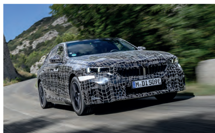
In Kürze ist er reif für den deutschen Straßenverkehr: der BMW i5 nach den letzten Testläufen in Südfrankreich.

Feinabstimmung für die Fahrwerksregel- und Fahrerassistenzsysteme des neuen BMW i5