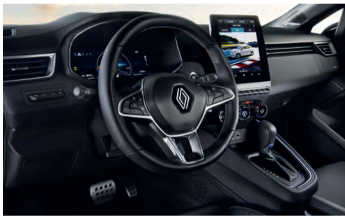
Das ansprechende Interieur des Clio vermittelt nicht selten das Gefühl, in einem Fahrzeug größerer Klasse zu sitzen.

Stolz sind die Schöpfer des neuen Clio aber nicht nur auf das gefällige Design. Technisch haben die Fachleute um Fabrice Camolive alle Register gezo-