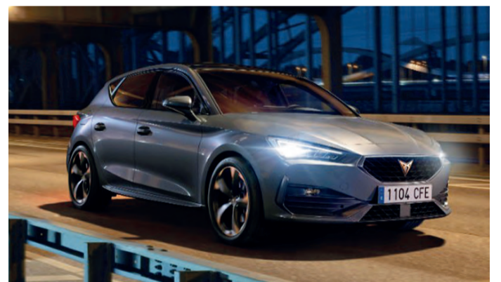
Ein lukratives Angebot für Vielfahrerinnen und Vielfahrer: Cupra bietet den Leon und Leon Sportstourer jetzt zusätzlich mit Dieselantrieb an.

Sowohl der kompakte Fünftürer als auch die Kombi-Variante ist ab sofort mit dem 150 PS starken 2,0-Liter-TDI-Motor bestellbar. Beide Modellversionen sind jeweils entweder mit einem manuellen 6-Gang-Getriebe oder einem 7-stufigen DSG verfügbar – und das zu kostengünstigen Kursen. So ist der Cupra Leon TDI mit manuellem 6-Gang-Getriebe ab 35.730 Euro bestellbar, mit dem 7-Gang-DSG ab 37.530 Euro. Der Cupra Leon Sportstourer ist mit manuellem 6-Gang-Getriebe ab 37.335 Euro erhältlich und mit dem 7-Gang-DSG ab 39.135 Euro.