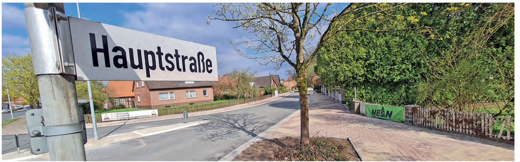
Bauabschnitt zwei ist fertig: Auf dem fehlenden etwa 70 Meter langen Teilstück an der Einmündung Westendorfer Straße (L 163) mussten die Bauteams wegen des kalten und regnerischen Wetters lange warten, bis die Asphaltdecke aufgebracht werden konnte. Eigentlich sollte der gesamte Abschnitt von der Böhmebrücke bis zur L 163 auf einer Länge von rund 430 Metern bereits vor Weihnachten 2022 fertig sein.

SCHWARMSTEDT. Die Wandergruppe des MTV Schwarmstedt trifft sich am Sonntag, 14. Mai, um 9.30 Uhr auf dem Rathausplatz, um in Fahrgemeinschaften zum Großen Bullensee nach Rotenburg zu fahren. Dort startet die rund zwölf Kilometer lange Wanderung gegen 11 Uhr. Eine Kurzstrecke mit etwa sieben Kilometern wird auch angeboten. Anschließend ist ein Kaffeetrinken vorgesehen. Anmeldungen bei Gerd Brozinski, ☎ (05071) 1008.