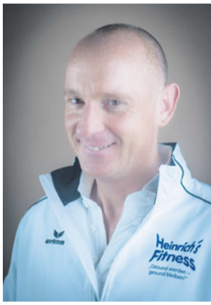
Rüdiger Heinrich Walsrode

Viele Menschen versuchen, jeden Tag 10.000 Schritte zu machen. Eine wissenschaftliche Grundlage für diese Zahl gibt es jedoch gar nicht, sie basiert lediglich auf einem Marketing-Gag aus den 60er Jahren. Damals nutzte eine Firma den Hype um die Olympischen Spiele in Japan und brachte den ersten transportablen Schrittzähler auf den Markt. Der Werbe-Gag etablierte sich schnell zu einer allgemeingültigen Empfehlung. Was allerdings durchaus stimmt: Bewegung ist gut für den Körper. 10.000 Schritte müssen es aber