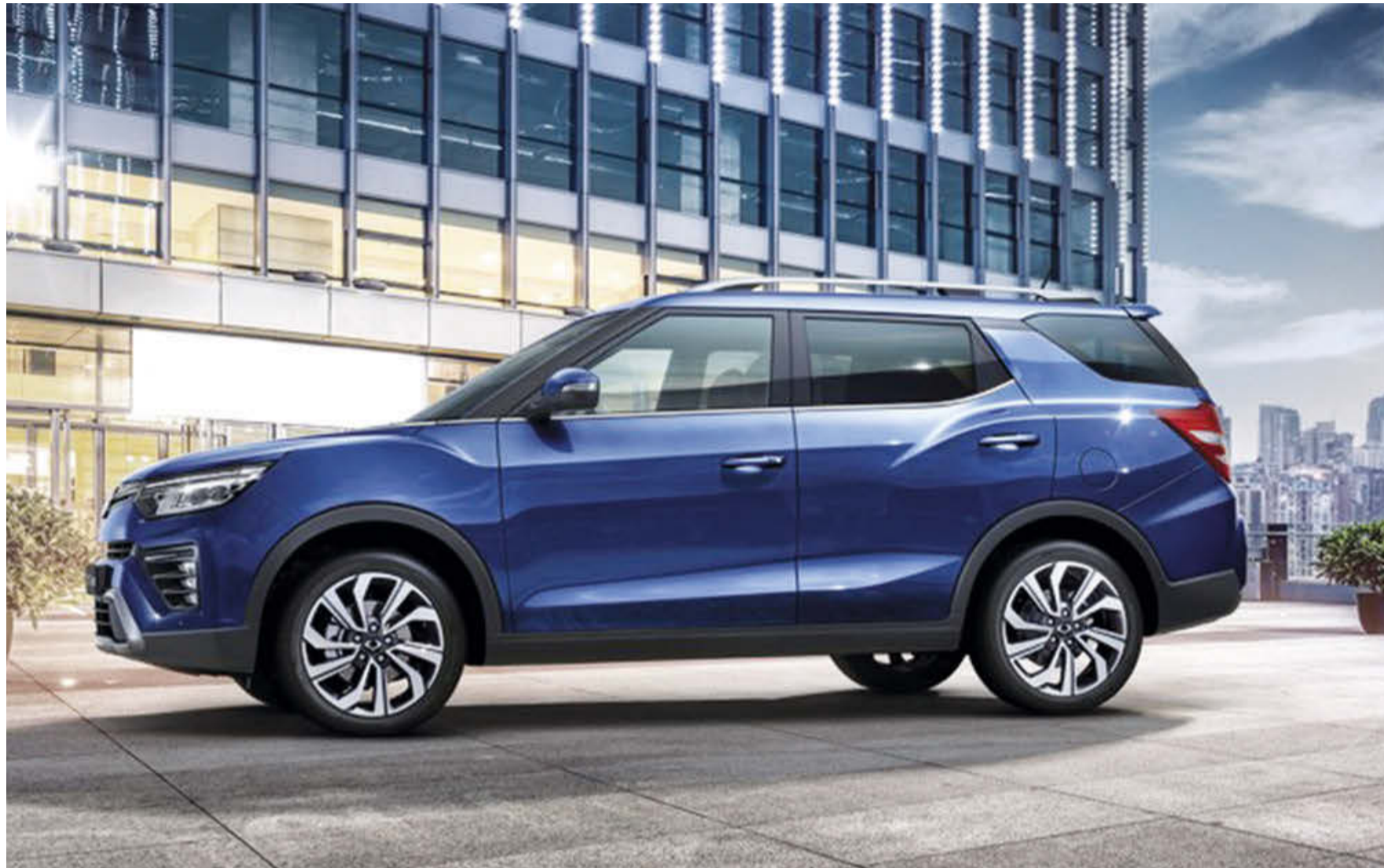
Wer viel Platz braucht, der ist mit dem SsangYong Tivoli Grand wirklich bestens bedient.

In Verbindung mit der optionalen Wandlerautomatik kann der Fahrer oder die Fahrerin mit dem Fahrmodusschalter (Sport, Winter und Normal) das Schaltverhalten und die Traktionsei-