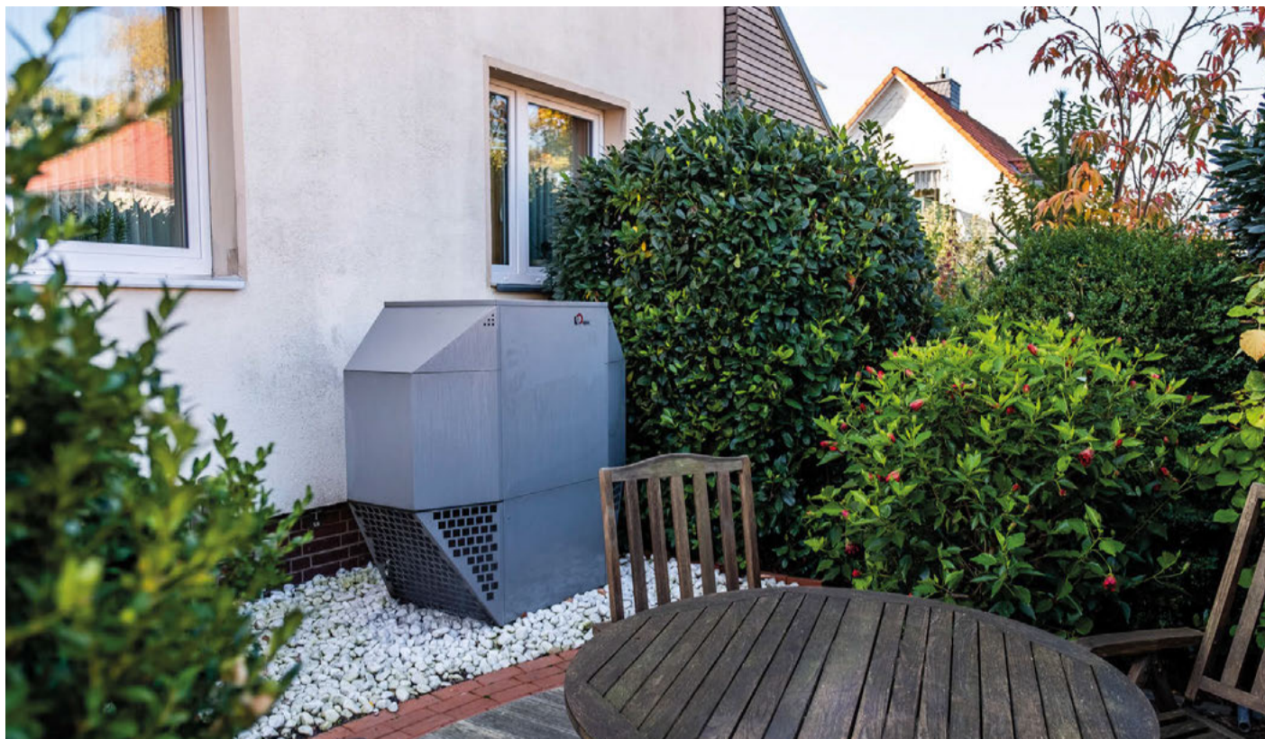
Ist die Wärmepumpe am eigenen Haus sinnvoll? Antwort gibt es am 13. März.

„Wärmepumpen sind das Heizsystem der Zukunft. In mittlerweile jedem zweiten Neubau in Deutschland werden Wärmepumpen installiert – in Bestandsgebäuden gibt es allerdings noch viel Potenzial: Denn auch in älteren Gebäuden kann der Einsatz von Wärmepumpen meist effizient und wirtschaftlich gestaltet werden“, erklärt Gerhard Krenz von der Klimaschutz- und Energieagentur Niedersachsen. Nur mit dem Umstieg auf erneuerbare Energien könne