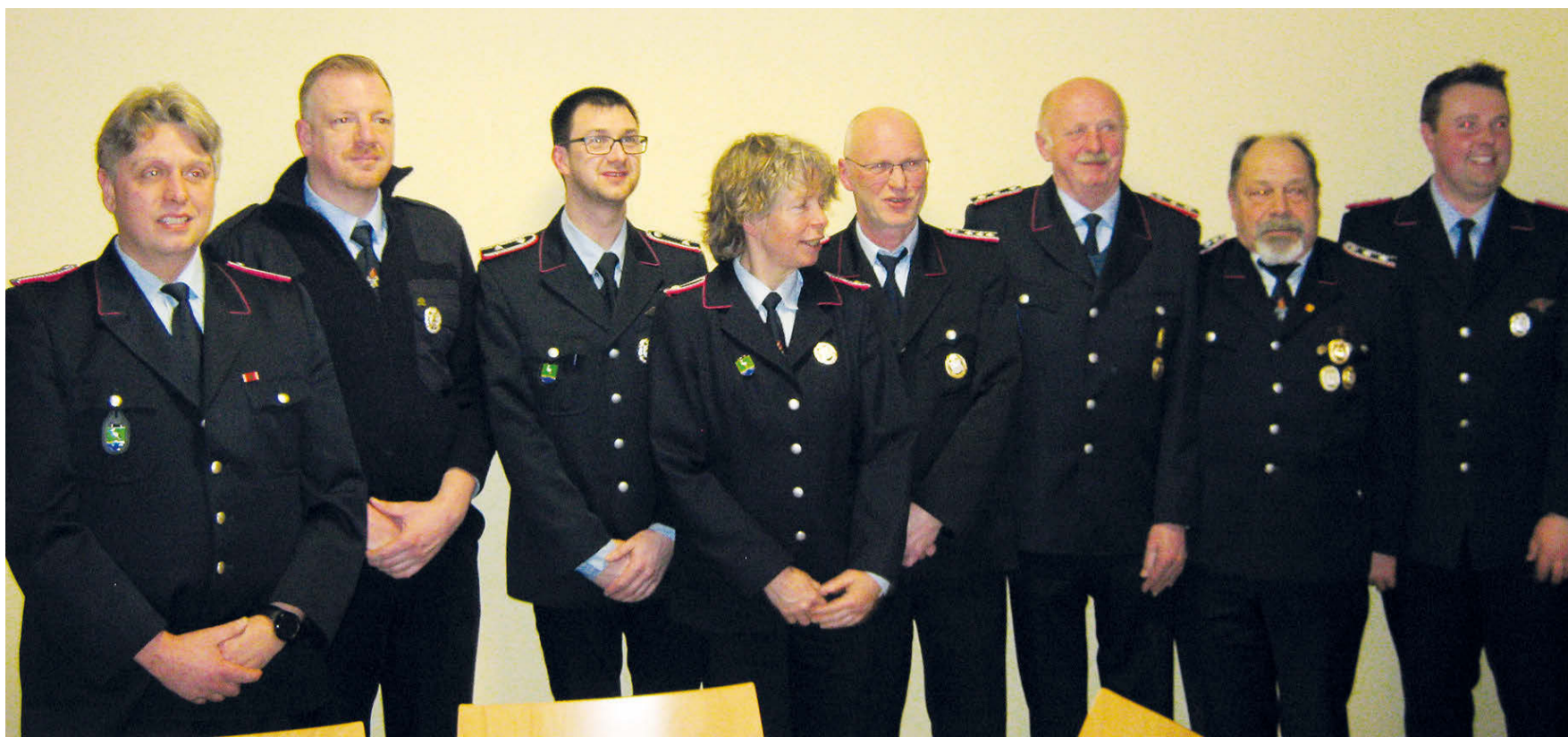
Versammlungen sind auch immer eine gute Gelegenheit für Ehrungen und Beförderungen – wie hier bei der Gemeindedienstversammlung der Feuerwehren der Samtgemeinde Rethem.