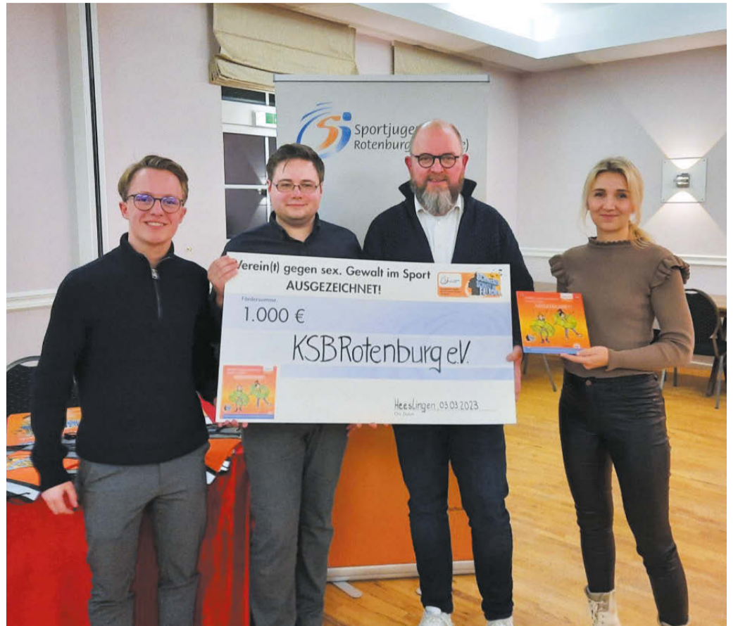
Die 1000 Euro von der Sportjugend Niedersachsen sollen für die Arbeit mit Kindern und Jugendlichen verwendet werden.

Die Auszeichnung umfasst eine Plakette für den Sportverein und ein Geldbetrag in der Höhe von 1000 Euro für die Arbeit mit Kindern und Jugendlichen. Beim Beratungsprozess und der Erarbeitung des Schutzkonzeptes wurde der KreisSportBund von der Sportjugend Rotenburg und vom Verein Wildwasser aus Rotenburg unterstützt.