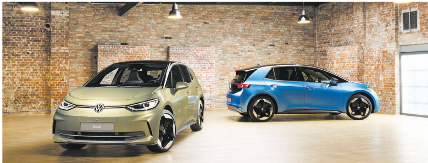
Zweieinhalb Jahre nach dem Stapellauf beginnt für den ID.3 von Volkswagen eine neue Laufbahn.

Von außen präsentiert sich das vollelektrische Modell aus der Kompaktklasse in einem frischen und geschärften Look: Die Front