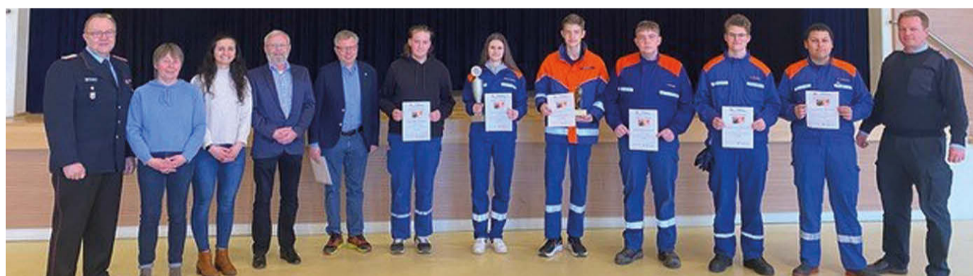
Die siegreichen Jugendlichen und ihre Gratulanten.