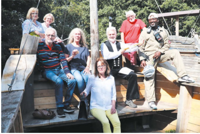
In diesem Jahr ist die Truppe auch bei den Theatertagen auf Balttrum dabei.