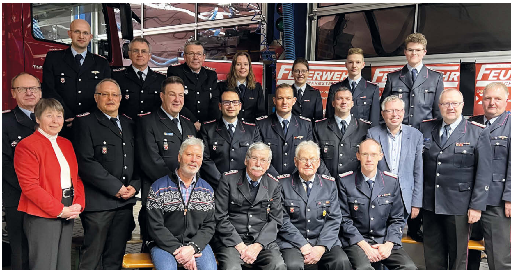
Geehrte, Beförderte und Gäste der Hauptversammlung der Freiwilligen Feuerwehr Schwarmstedt.